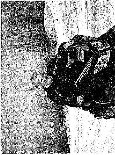
Pääsiäisenä 2008 Norjan Tromssassa ja alla 800 XP Renegade.

Lomat vietän usein mieli menopelieni parissa; Joulunpyhä 2007 ajoin endurolla Malagan vuorilla, Pääsiäisenä 2008 moottorikelkalla In-