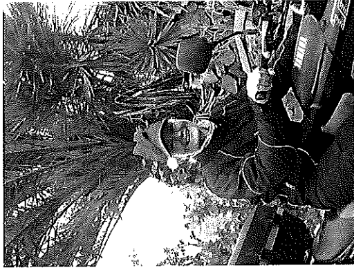
Jouluna 2007 enduro-safarilla Malagassa; alla Yamaha TDM 850

ros ennätyksen. Täytyy sanoa, että oli kyllä aika huikkea olo, kun odotin valojen vaihtumista 21:n muun formulan kanssa Nurburgringin startti alueella. Kauden 2008 ajan vain Euroopan kisoja; lisäksi voit katsoa racing kotisivuiltani alla olevan linkin kautta: http://www.emerentsiaracingteam.com/