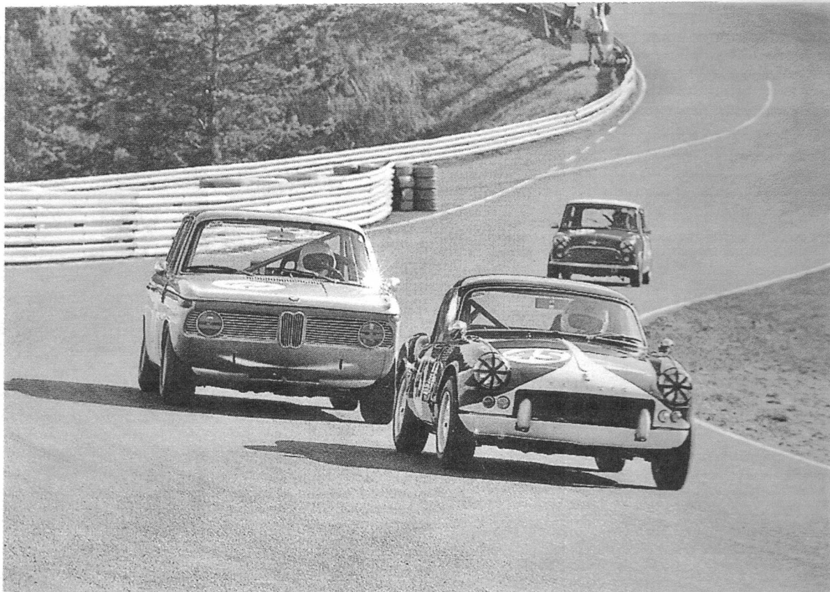
Jari Tabell ja Triumph Spitfire